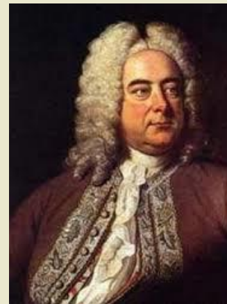
G.F. HÄNDEL (1685-1759)

En ambos casos el resultado rítmico es que se produce una entrada de la melodía en cada compás con una anticipación de medio tiempo, es una anacrusa que desplaza brevemente el ritmo creando la característica forma de la zarabanda.