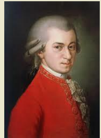
W.A. MOZART (1756-1791)

https://www.youtube.com/watch?v=7cb1QmTkOAI