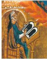
Hildegard von Bingen