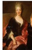
Elisabeth Jacquet de la Guerre