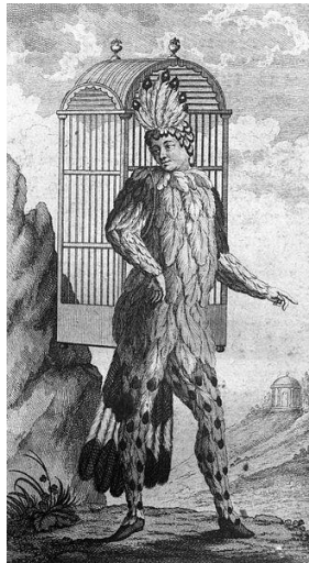
W. AMADEUS MOZART (1756–1791)