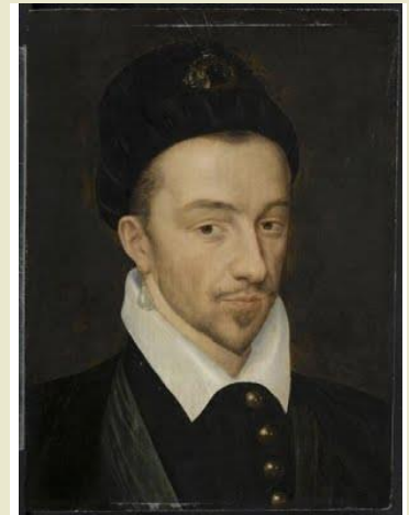
CLÉMENT JANEQUIN (C. 1485 – 1558)

Compositor francés. Fue uno de los grandes maestros de la canción polifónica descriptiva francesa de la primera mitad del siglo XVI. De su infancia y su juventud se desconoce prácticamente todo; es posible que fuera discípulo de Josquin Desprez, el compositor más destacado de la época. En su época fue un popular compositor del que se publicaron sus libros de "chansons", canciones que en estilo contrapuntístico representan la esencia de la música renacentista.