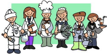
1 de Mayo

12 de octubre, el Pilar, fiesta Nacional. Este día está regulado por Ley. Se hace un desfile militar al que asiste la familia real así como el presidente del gobierno y otras autoridades.