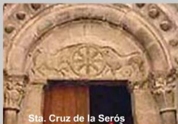
Sta. Cruz de la Serós

Además de la iconografía en la que se representan escenas y personajes religiosos, también se incluyen símbolos, como el Crismón, círculo en el que se inscribe el anagrama de Cristo.