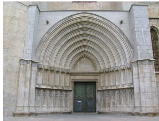
Puerta de la Catedral de Gerona