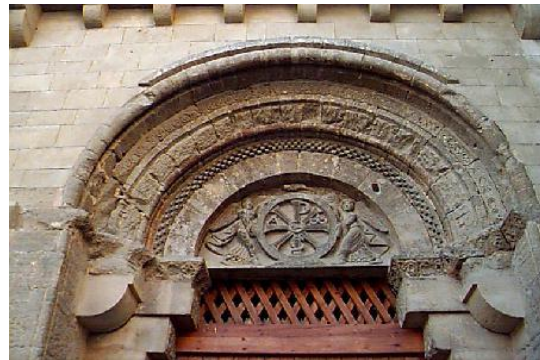
San Pedro el Viejo. Huesca