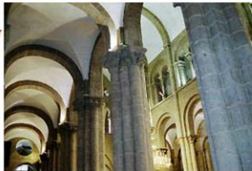
bóveda de arista