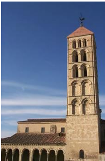
Iglesia de San Esteban, Segovia.

Escribe junto a cada fotografía si es de estilo románico o gótico