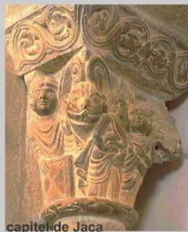
capitel de Jaca

La escultura en el románico está supeditada a dos condicionamientos: El espacio donde se va a situar. El contenido, fundamentalmente religioso de su temática. La escultura sirve para ornamentar capiteles, tímpanos y arquivoltas de las portadas, ciñéndose estrictamente a los volúmenes de piedra de la construcción. El carácter sagrado de los edificios donde se coloca la escultura determina los temas, que se refieren al antiguo y nuevo testamento.