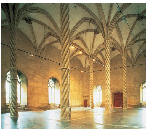
Lonja de Palma de Mallorca, obra maestra de Guillermo Sagrera