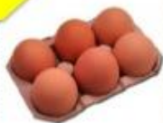
Media docena de huevos