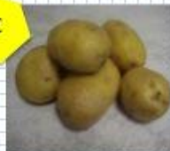
1 kilo (Kg) de patatas