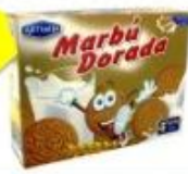
1 caja de galletas