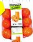
1 bolsa de naranjas