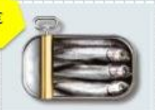
1 lata de sardinas